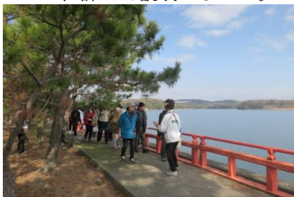
常盤神社脇の周遊路

常盤堤東荒手石橋、飛び上がり地蔵尊、石炭記念館横の「蒸し杵の碑」「向田兄弟の碑」「常盤池の碑」も見ていただきました。字名である「石切場」と本土手基礎石との関連や常盤神社内の鳥居、灯笼などの石像物を案内しました。特に関心が高かった本土手周り、荒手水路と石橋については、詳しく説明しました。