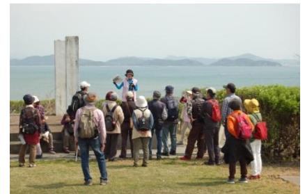
ニュージーランド病院記念碑前

まずは境内より丸尾港を望みながらその歴史に思いを馳せ、その後は古樹の生い茂る神社境内の周遊路を巡り次の大須賀遺跡へ。現在は住宅が建ち並び1800年前の古墳時代前期の人々の様子を偲ぶことは叶いませんが、出土した石棺や土器、さらに300余名の東岐波中学校の生徒が発掘作業に協力当時の写真を見て頂き、よすがとしました。