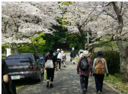
護国神社の桜はほぼ満開

桜の花がどこかしこと咲き誇りその参道の先は宗隣寺です。福原家の菩提所で14代から26代の領主が祀られて毎年11月第2日曜日に法要が営まれています。まつりのにぎやかさが聞こえてきました。ここが護国神社です。