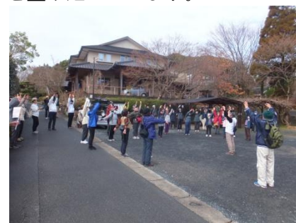
駐車場集まって準備体操 創建以来、少なくとも22度の

ふるコンの行事としては4年ぶりになりますが、前回と変わらない40名近い方の参加を頂きました。今回は蓮光寺を出発し、上中野・大森の旧道を散策、途中「西宇部ふれあいセンター」で休憩をとり、大森荒神社に至るルートとしました。見所としては地蔵尊や神社、寺院そして宇部競馬場跡等を盛り込んでいます。